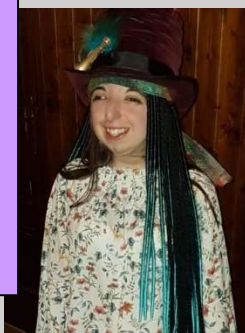
Almudena 25, 18 enero